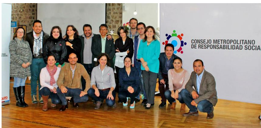
Miembros del CMRS 26 julio del 2016.